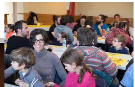
Les gagnants du gros lot « Un pass pour 4 personnes au parc Disneyland »