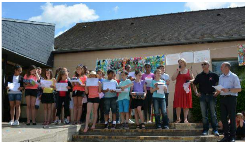
Remise des diplômes de secourisme