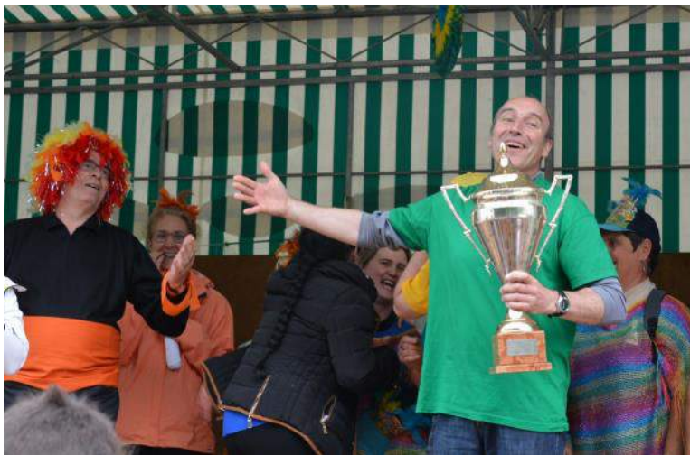
L'important n'est pas de vaincre mais de participer

Venez nombreux rejoindre nos rangs et porter haut les couleurs de votre village.