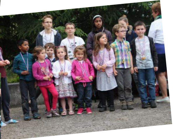
Cérémonie de remise des médailles