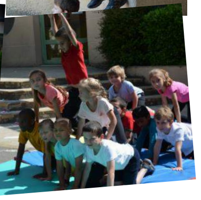
Spectacle de fin d'année