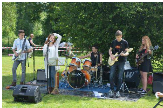
Kermesse de l'école